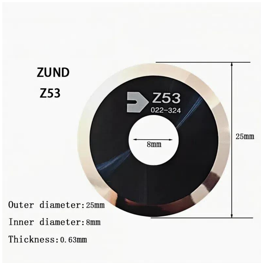
Zund Z53 Tungsten Carbide Rotatary Knife Blade 4800059