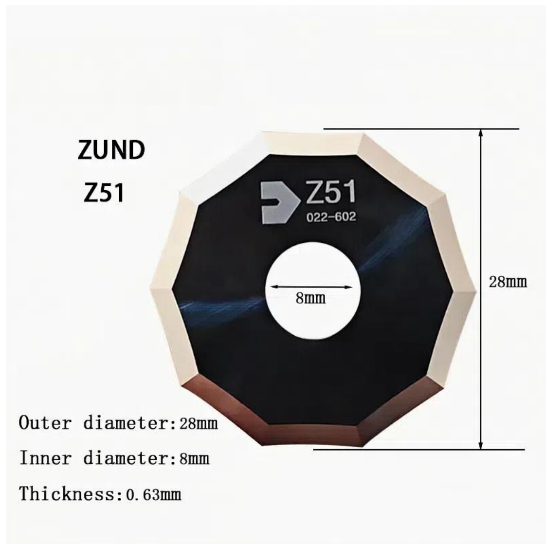
Zund Z51 Decagonal 10-Sided Rotatary Knife blade 3910336

G42444844, Zünd Z50 3910335, Gerber MCT R50, Summa 500-0860 500-9860, Kuris 83906, Đại tràng T00360, iEcho E50, Người da đen & BW50 trắng, Comagrav CD25, Đa cam 003612-MC50, Người bắt nạt B50, Gunnar GR926